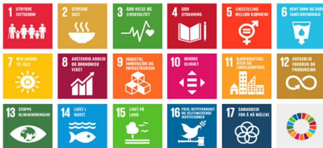
Figur 2 FNs bærekraftsmål

Gjennom naturavtalen 4 som ble inngått i desember 2022, har Norge bla. forpliktet seg til at tap av natur skal stoppes og reverseres innen 2030. Kommunesektoren vil få en sentral rolle i gjennomføringen av denne avtalen.