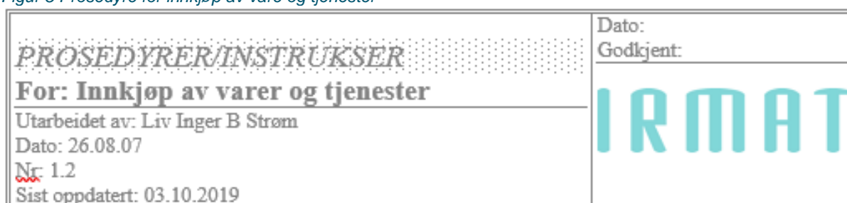
Figur 5 Prosedyre for innkjøp av vare og tjenester