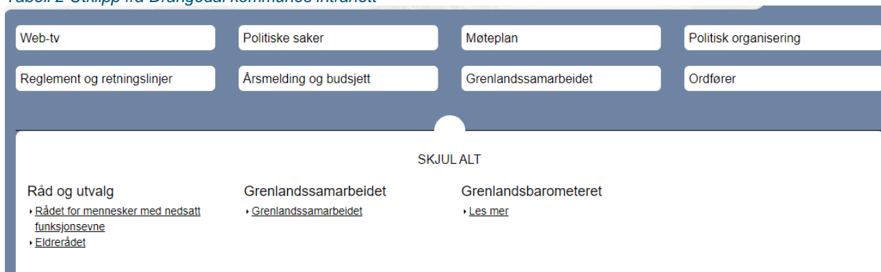
Tabell 2 Utklipp fra Drangedal kommunes intranett

Kommunalsjef for økonomi og utvikling sier at aktuell informasjon om innkjøp og anskaffelser ligger på GKI sine nettsider. Det er lenke til GKI sine nettside på kommunens nettsider under fanen Politikk og innsyn og videre Grenlandssamarbeidet :